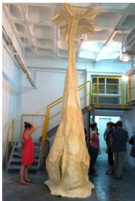
10 — נעמה סניטקוף-לוטן קוסטא דחיותא 1, 2011 נייר משי ודבק, גובה: 450 ס"מ, קוטר בתחתית: 150 ס"מ אוסף האמנית