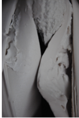
8 — הודיה חנונה Acrumen (פרט), 2012 יציקות פורצלן, 35x60 ס"מ אוסף האמנית