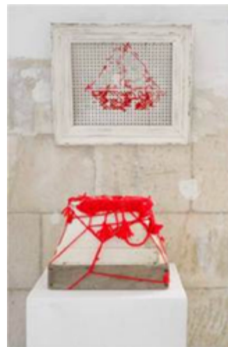
5 — רעות זוארץ-עמרני דם וחלב (סדרה): הביתה, 2010 עץ, צמר, צבע אקרילי 31x21x25 ס"מ; קורבן יולדת, 2011 רדי-מייד (פתח אורור) צמר, אקרילן 45x35 ס"מ; אוסף האמנית

מוריה אדר-פלקסין (נ' 1984) יוצרת כלים בסגנון הוודג'ווד האנגלי מהמאה ה-18, ובמקום לשבץ בהם תבליטים של גיבורים אלמותיים מן המיתולוגיה, היא בוחרת לתעד מיתולוגיות פופולריות עכשוויות, כגון פרשיית האהבים המתקשרת בין הדוגמנית הישראלית בר רפאלי לשחקן האמריקאי ליאונרדו דיקפריו. הבחירה להעמיד מיתולוגיה קלאסית מול מיתולוגיה עכשווית ברורה, אולם דומה כי ברובד האישי של העבודה, שנוצרה על ידי אמנית דתייה, ניתן לקרוא בה גם בחינה של סוגי הבניות של נשיות, כפי שמציגה את הדברים האמנית עצמה – מחד גיסא, הנשיות הדתית המופנמת והמודחקת, ומאידך גיסא, זו המתפרצת של הידוענית, המיוצגת כאן בלבוש ביקיני (תמונה 6). 12 לדברי אלה ארזי, העבודה הזאת נותנת "דרור לביטויי מיניות ויחסים בין המינים, נושא שלא קיבל מעולם מספיק ביטוי בחברה הדתית". ארזי מוסיפה: "אולי זו גם הסיבה שהעבודה מכונה 'More'". 13