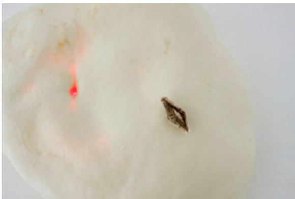
2 — שולמית עציון

העיסוק בגוף, בנשיות ובמיניות בולט אצל רבות מהאמניות המשתתפות בפרויקט "סטודיו משלך". להלן אציג כמה עבודות בולטות בתחום זה. שולמית עציון (נ' 1979) עוסקת לא פעם בגוף הנשי ובפריון בשפה פואטית הטעונה ברמזי כאב, סכנה ומיניות. עציון יוצרת עבודות שהגוף הנשי מופיע בהן כשהוא מפורק, למשל ידיים היוצאות מן הקיר כשעל כפותיהן סירת מפרש זעירה ששפתיה תפורות בחוט ורוד, כאזכור לאיבר מין נשי שמור ומוגן (תמונה 1). בעבודה אחרת מופיעה בטן נשית חשופה העשויה מפורצלן, כשאור אדום הנראה כטיפת דם ניגרת מהבהב מתוכה (תמונה 2). האור האדום המהבהב טוען את העבודה באמביוולנטיות ובאניגמטיות, ספק מבשר פרוין, ספק מבשר בָּלוּת. אותות של תקווה מתערבלות בעבודה זו באותות של אזהרה. גם על הבטן עומדת סירה "ואגינלית" קטנטנה מקלף מקופל, שהמלה "רווקה" מודפסת עליה שוב ושוב. מיניות ופריון מתחברים כאן לשאלת הרווקות המאוחרת, נושא מרכזי בשיח היהודי הדתי בשנים האחרונות. 5