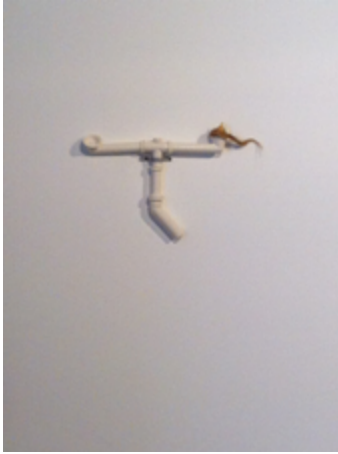
9 — הודיה חנונה Acrumen (פרט), 2012 יציקות פורצלן, 45x35 ס"מ אוסף האמנית