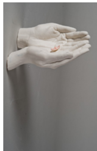
1 — שולמית עציון אישי, 2011 שעווה, עור וחוט תפירה 16×5 ס"מ אוסף האמנית

בטן ("רווקה, רווקה, רווקה..."), 2011 פורצלן, גוף תאורה, קלף, 40×20×10 ס"מ אוסף האמנית